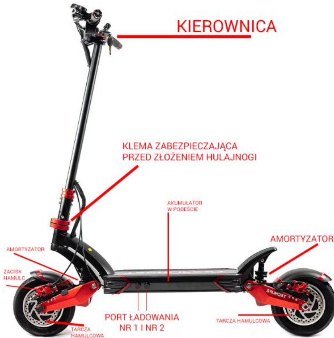
Rysunek 2: Budowa Hulajnoги

Ogólna budowa hulajnoги przedstawiona jest na poniższym rysunku. Rama i części mogą się różnić w zależności od modelu i konfiguracji.