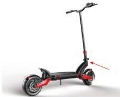
1. Wyłącz zasilanie

Po skończonej jeździe należy złożyć hulajnogę. Należy zwrócić szczególną uwagę, by składanie rozpocząć od wyłączenia zasilania.