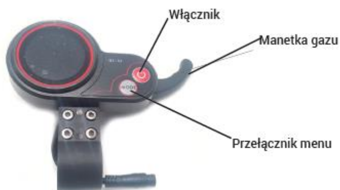
Rysunek 3: Wyświetlacz Technlife X5, X5S, X5 STREET X6, X7, X7s, X7 LITE, X8, X8S, X9