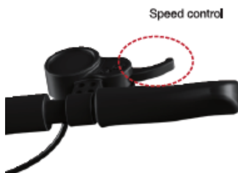
Rysunek 4: Regulacja prędkości

Za pomocą uchwytu użytkownik może kontrolować prędkość w zależności od aktualnej sytuacji panującej na drodze.