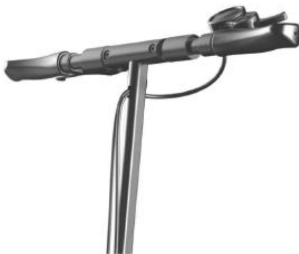
Rysunek 1 Uchwyt