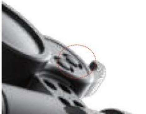
2. Odblokuj uchwyt