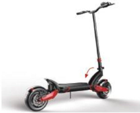
3. Opuść kierownicę w dół